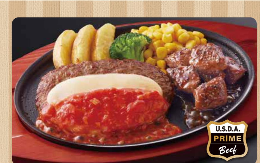
044 奶酪汉堡排&至尊骰子牛排 ¥999 (含税 ¥1,098)