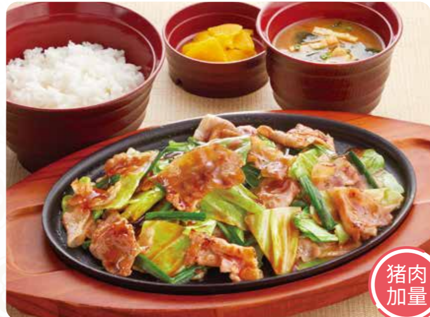
109 大分名菜韭菜猪肉套餐 ¥899 (含税 ¥988) 153 大分名菜韭菜猪肉(单品) ¥799 (含税 ¥878)