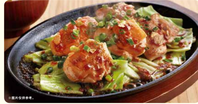
054 蒜香酱油一口鸡排 ¥599 (含税 ¥658)