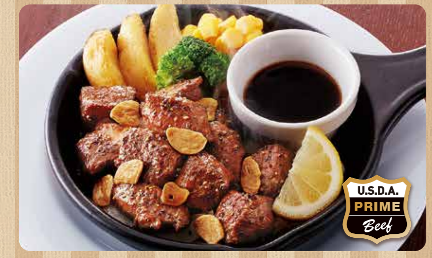
045 至尊骰子胡椒牛排 ¥1,039 (含税 ¥1,142)