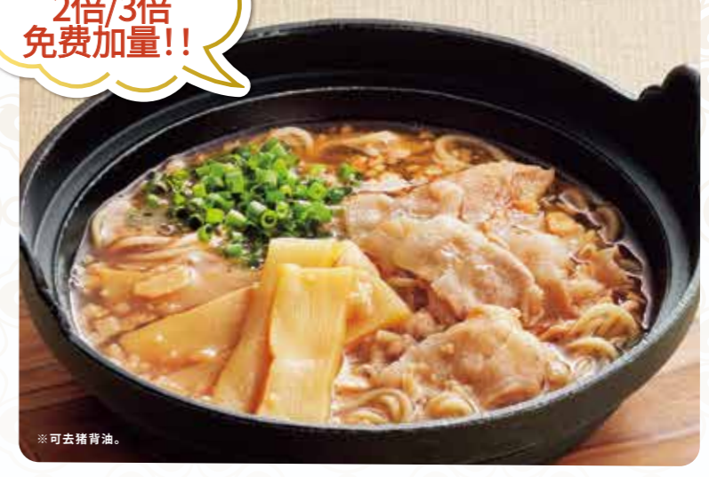
192 醇香猪背油铁锅酱油拉面 ¥699 (含税 ¥768) 大份面条 + ¥139 (¥152)