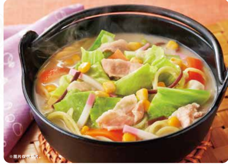
193 MAX 蔬菜杂烩面 ¥839 (含税 ¥922)