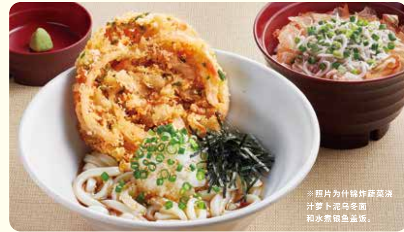
※照片为什锦炸蔬菜浇汁萝卜泥乌冬面和水煮银鱼盖饭。