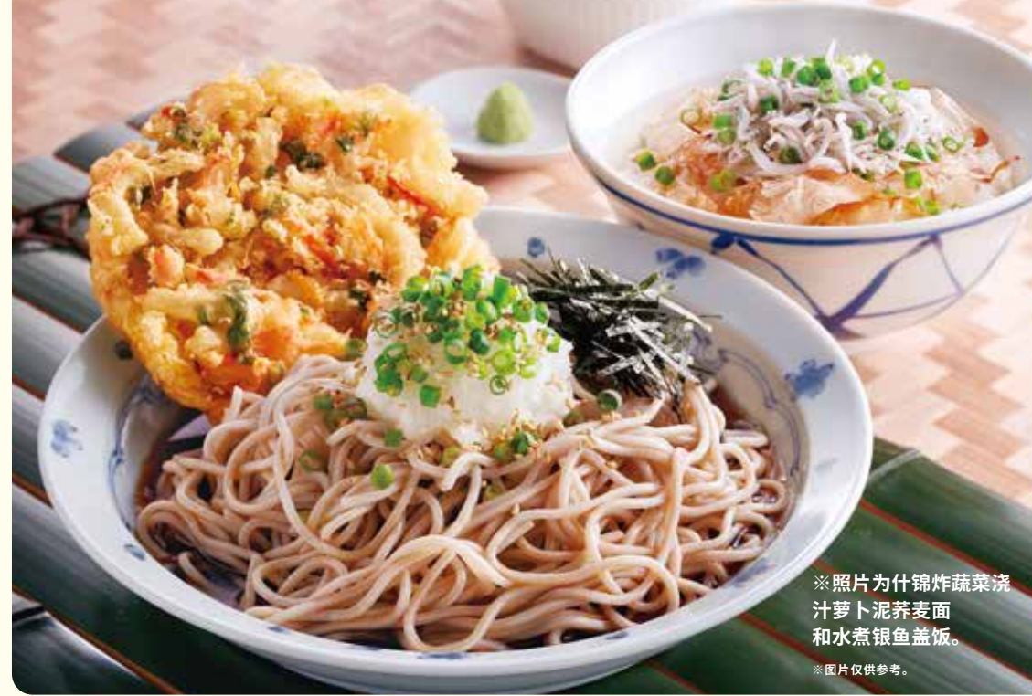
※照片为什锦炸蔬菜浇汁萝卜泥荞麦面和水煮银鱼盖饭。 ※图片仅供参考。