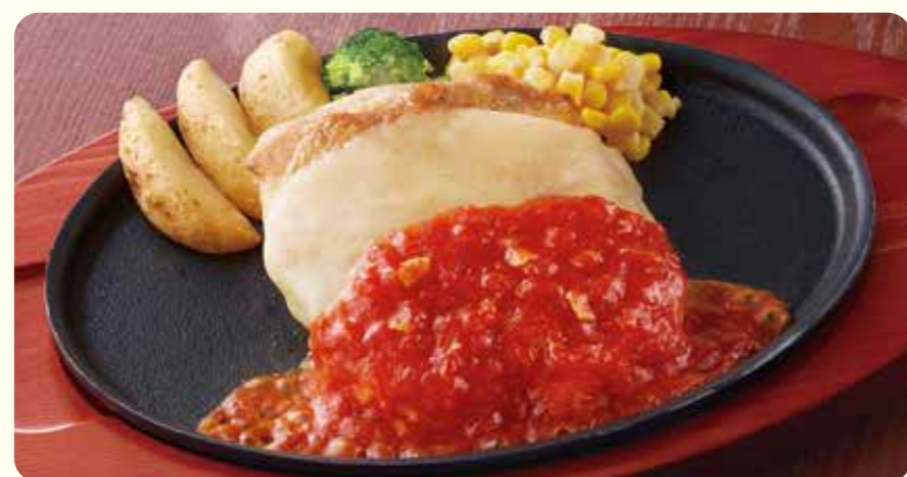
040 MAX 奶酪意式鸡排 ¥639 (含税 ¥702)