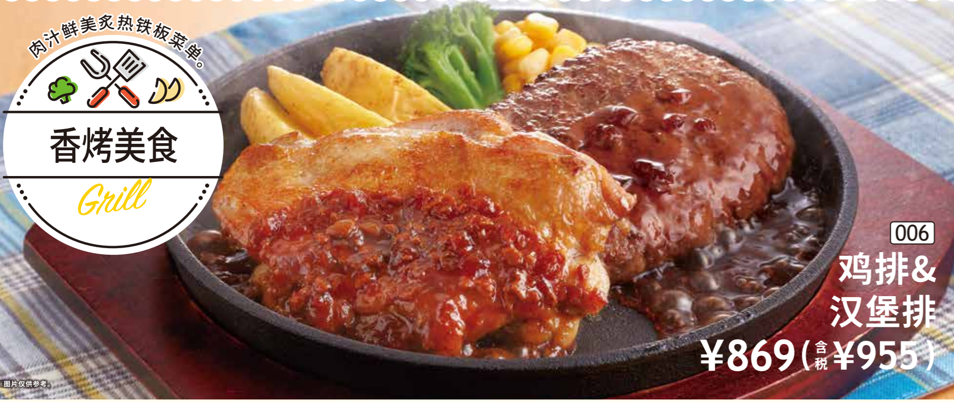
006 鸡排&汉堡排 ¥869 (含税 ¥955)