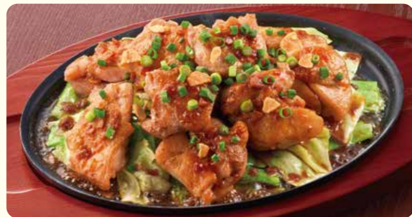
055 超大份蒜香酱油一口鸡排 ¥899 (含税 ¥988)