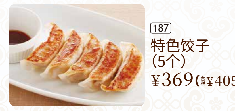
187 特色饺子 (5个) ¥369 (含税 ¥405)